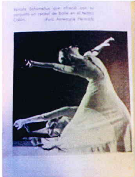
Renate Schottelius, Archib Teatro General San Martín

Im Zentrum des Sücks Die Farce der Suche steht der abwesende Körper von Renate Schottelius, der durch die Inszenierung mit Hilfe der gefundenen Dokumente und Videoaufzeichnungen (z.B. Interviews mit Weggefährten von Schottelius) erinnert und in dne Bühnenraum gebracht wird. Zu diesem Zweck wurden verschiedene Verfahren entwickelt, die stets den unüberbrückbaren zeitlichen Abstand sowie die Verschiedenheit der Körper miteflektiert und ausstellt. So tauchen am Ende immer mehr Widersprüche zwischen der offiziellen Tanzgeschichtsschreibung und den gefundenen Dokumenten auf, Widersprüche, welche die Inszenierung nicht löst, sondern bewusst ausstellt.